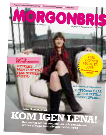
Morgonbris nr 2/2011

S-kvinnor är radikalare än partiet och vill mer inom miljöpolitiken, familjepolitiken och den ekonomiska politiken. Förbundet har också skarpare åsikter när det gäller vinster i