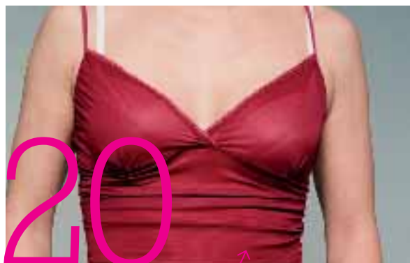
Mammografi, en klassfråga

18. FRAMGÅNG FÖR S-KVINNOR – Reproduktionen ska värderas lika som produktionen i nya partiprogrammet.