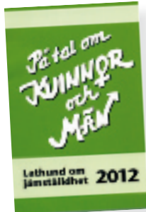
Nyss utgiven: »På tal om kvinnor och män«.

Boken kostar 40 kronor, men kan laddas ner gratis från SCBs hemsida www.scb.se .