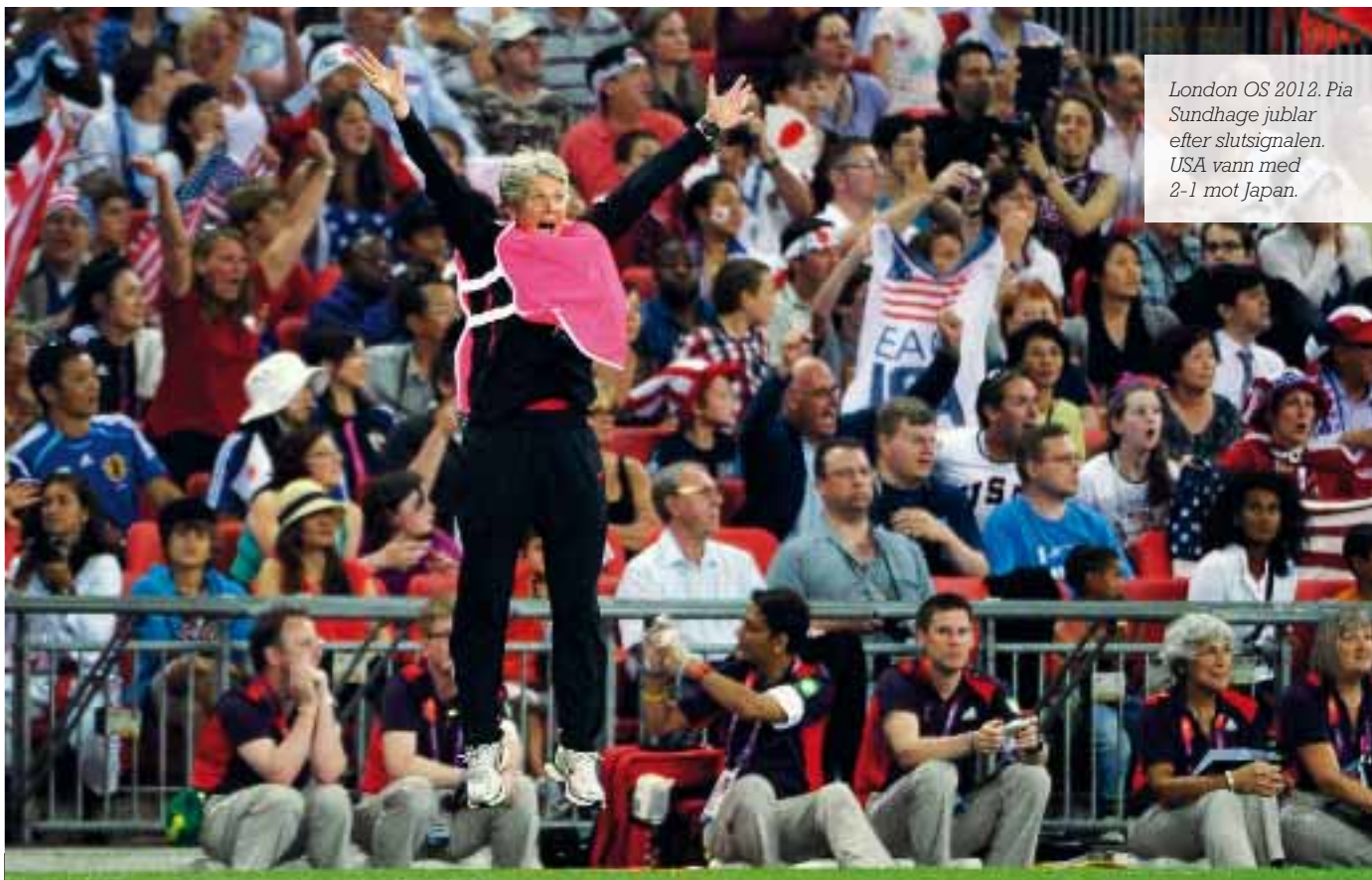
London OS 2012. Pia Sundhage jublar efter slutsignalen. USA vann med 2-1 mot Japan.