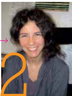
Nivin om kampen mot den patriarkala världsordningen