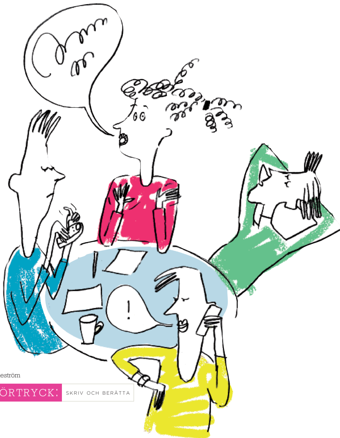
ILLUSTRATION: Anna Gunneström