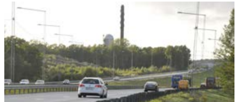
Verkstaden läggs mellan värmeverket och motorvägen.