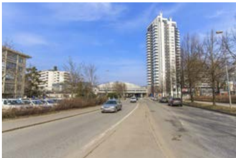
... och nu.