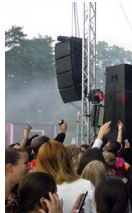
Mohombi ger publiken en Bumpy Ride.