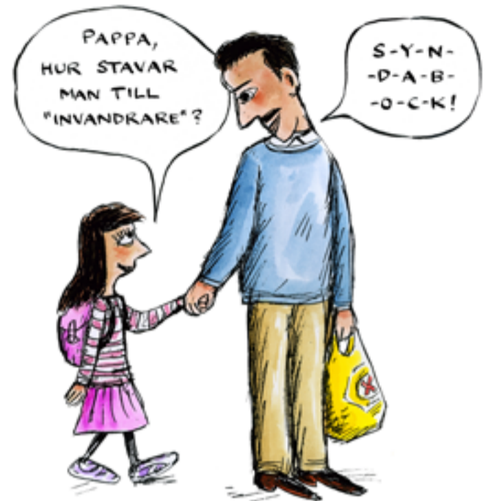
ILLUSTRATION: ROBERT NYBERG