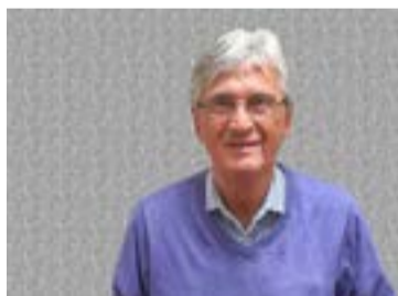
Lars Ternblad.

Samma vy 2015. Nu har allting förändrats mycket; både gator, centrum och nya Tyresö View som är det nya riktmärket.