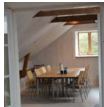
Kontorsmiljö med charmen av takbjälkar och vedkaminer.