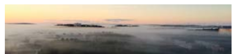
Soluppgång över disbeslöjad Myggdalsvägen.