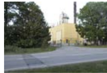
Vagnhallen läggs i bergrum under värmeverket.

Det finns idag sex vagnhallar och verkstäder i länet. Man undersök-