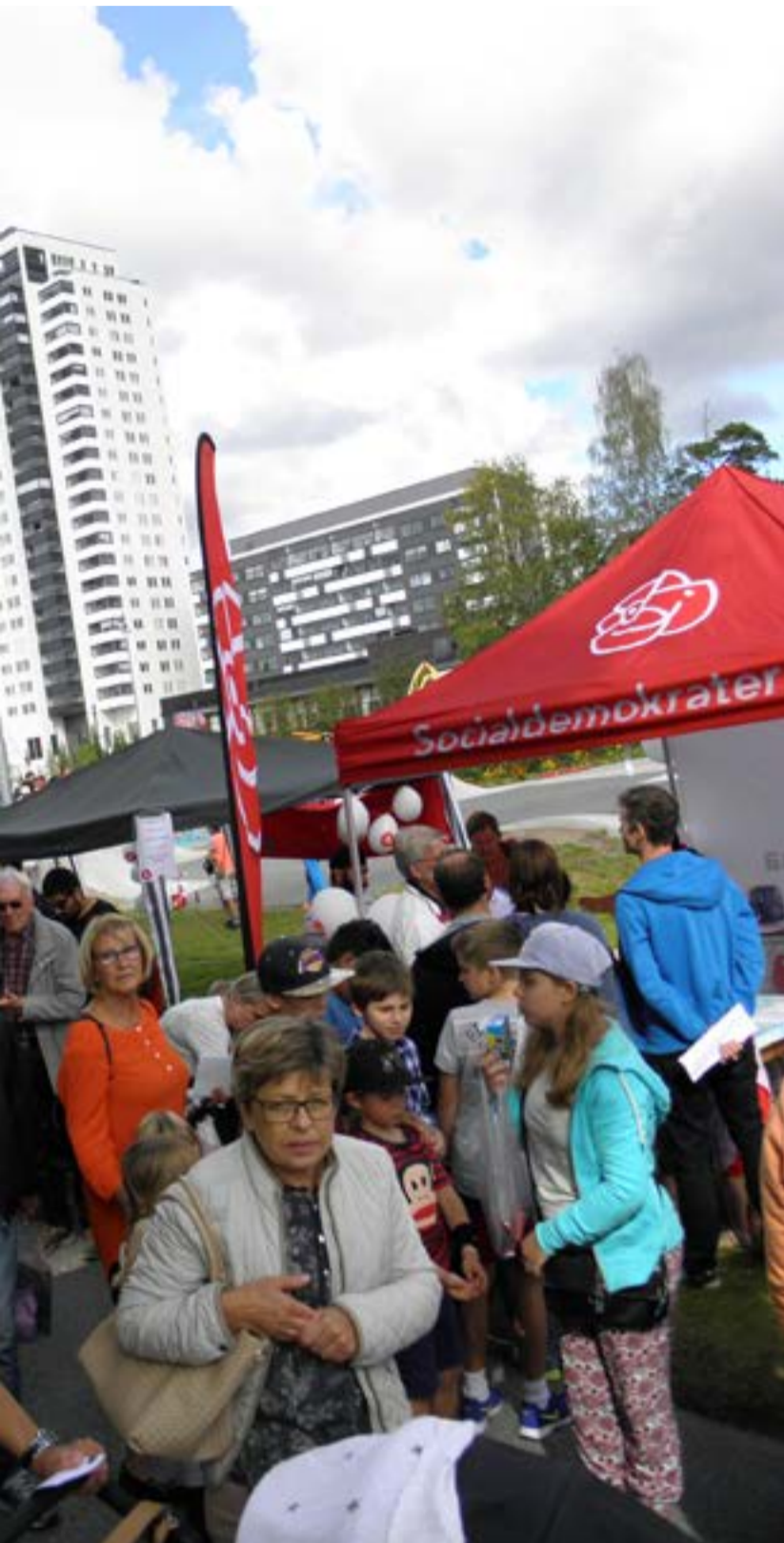
a för att locka till samtal med tyresöborna.