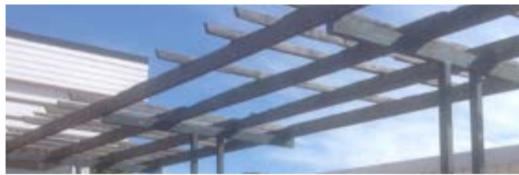
Inte i bästa skick enligt insändarskribenten.