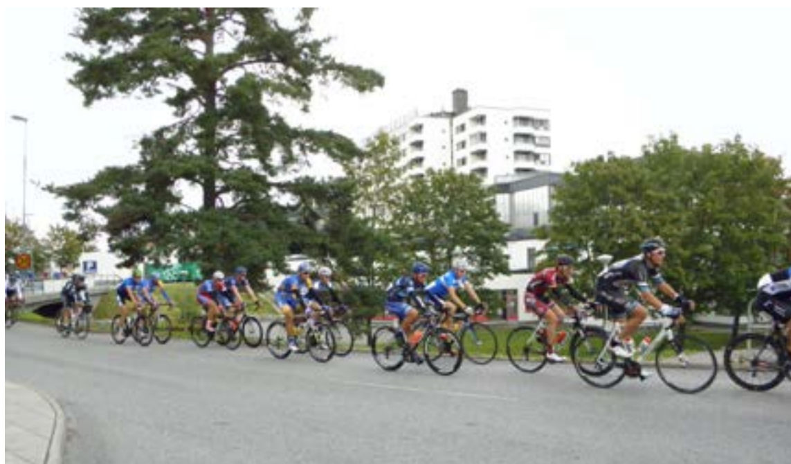
Cyklister i världsklass rullade genom Tyresö.