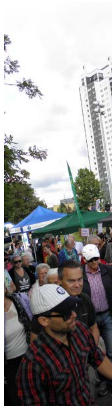
De olika politiska partierna gjorde sitt bästa.