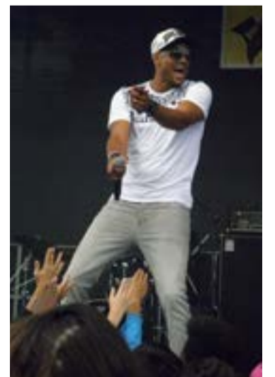
Världsstjärnan Mohombis glädje på scenen smittar av sig.

Under konserten på Tyresöfestivalen sjunger han flera av sin hits, bland andra Coconut Tree och debutsingeln Bumpy Ride, som höjer stämningen rejält. Publiken kan hans sånger utantill och sjunger med. De närmast scenen försöker få närbild och hanom. Till publiken säger han: