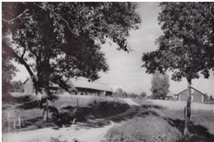
Tyresö då ...

FOTO Tyresö har genomgått en stor förvandling ända sedan vi flyttade hit 1961, berättar fotografen Lars Ternblad om dessa bilder.