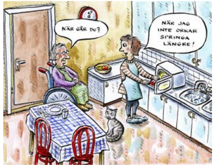
ILLUSTRATION: ROBERT NYBERG