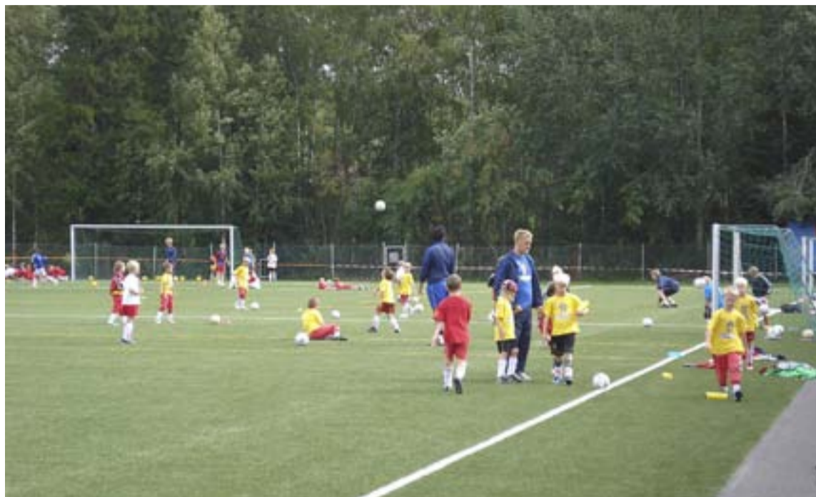
Full fart på konstgräsplanerna på Trollbäckens IP.

Kultur- och fritidsnämnden har i mars beslutat att hos kommunstyrelsen ansöka om investeringspengar för att sätta igång markarbeten som skulle göra det möjligt för en privat entreprenör att finansiera, bygga och driva en