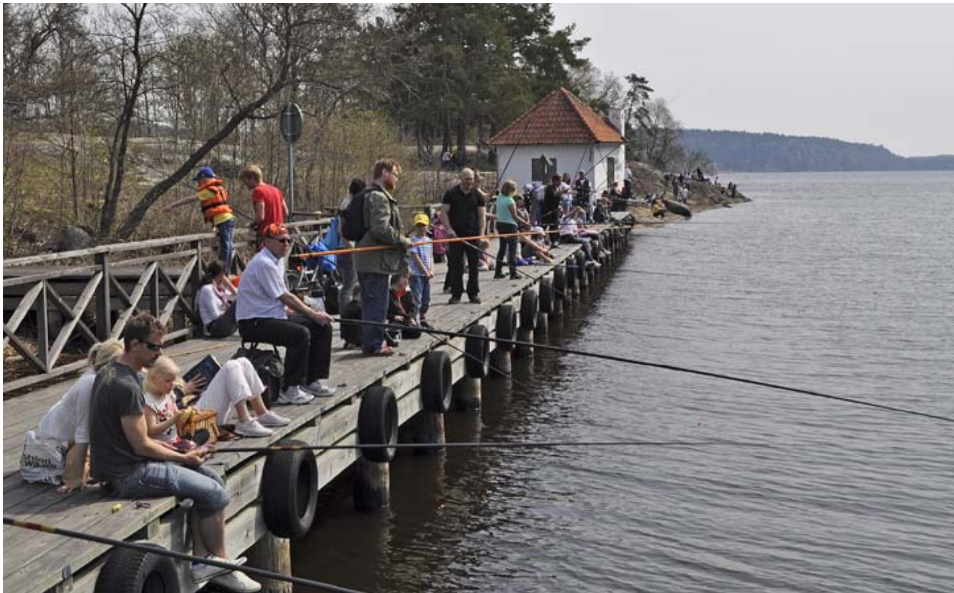
Den 29 maj fylls Notholmen med fiskare. Tyresö Fiskevårdsförening arrangerar traditionsenligt Första Metardagen varje Kristi Himmelfärdsdag.