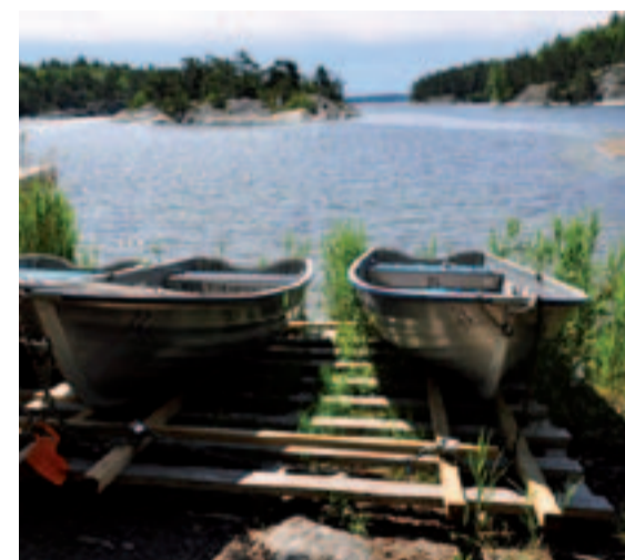
Runt om i kommunen har föreningen båtar som kan hyras via www.tyresofiske.se .