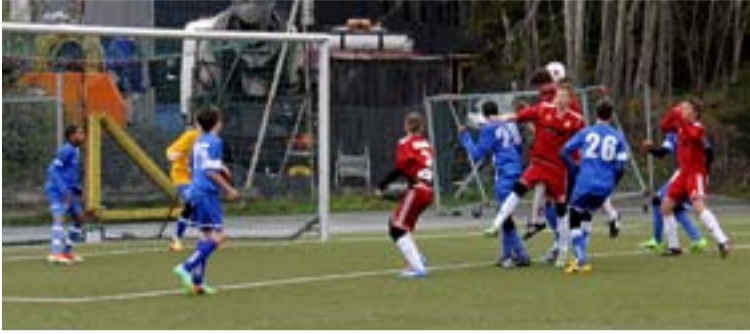
Organiserad idrott är ovanligare bland Tyresös ungdomar.

HÄLSA Enligt en kartläggning som Stockholms Idrottsförbund har gjort, är det allt färre ungdomar som idrottar trots att alla kommuner i länet har vuxit i antal.