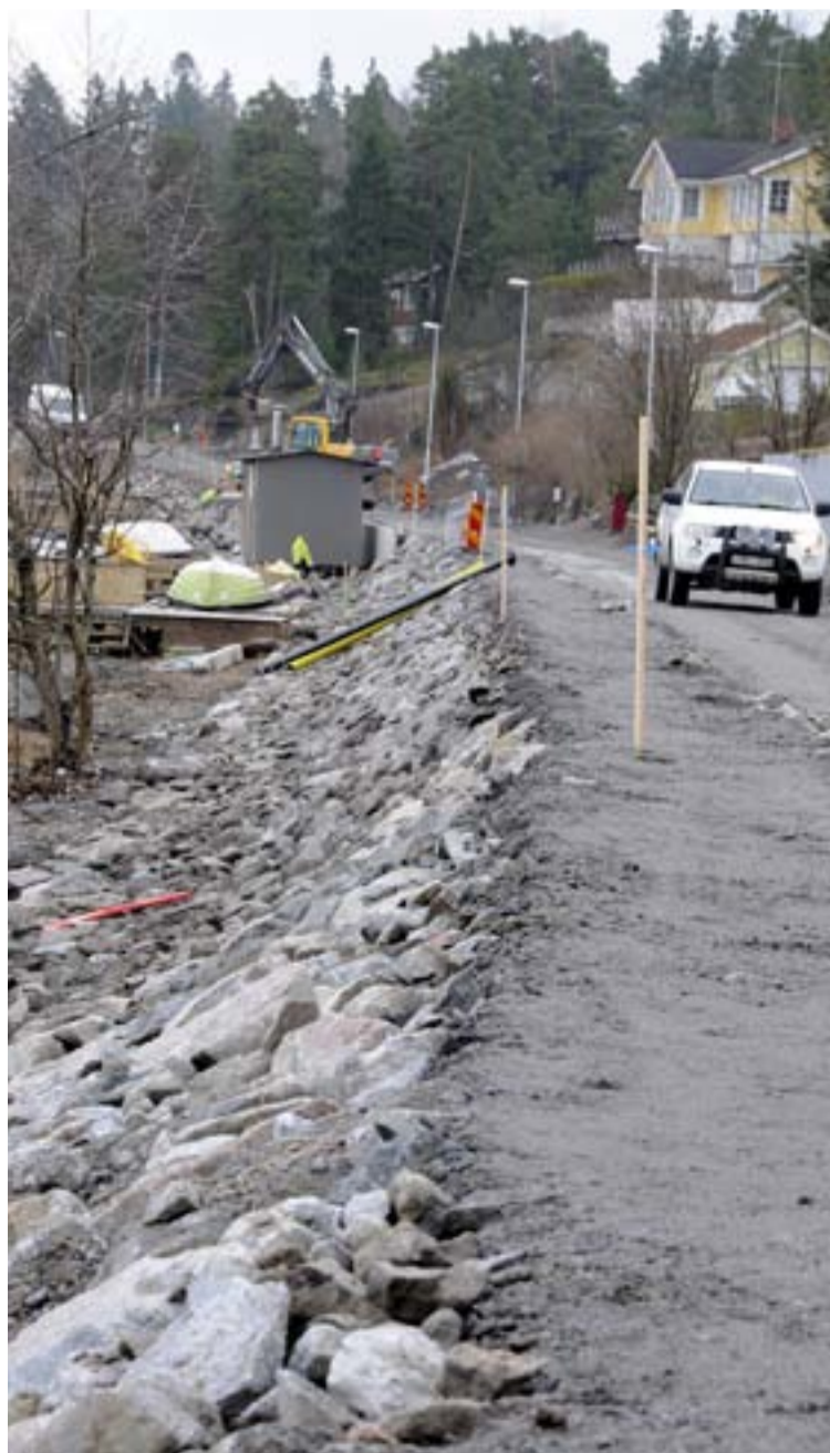
Rundade stenar skyddar mot Erstavikens vågor.