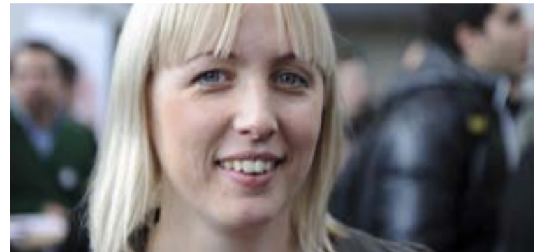
Jytte Guteland (S) har besökt Tyresö.

BESÖK Socialdemokraternas toppkandidat till Europaparlamentet, Jytte Guteland, var på helgdagsbesök i Tyresö nyligen. Under dagen gjorde hon både företagsbesök, träffade elever på Tyresö gymnasium och samtalande med tyresöborna.