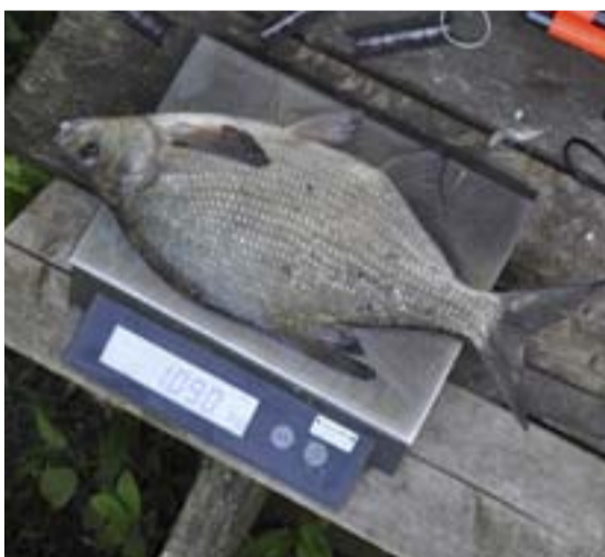
Alla fiskar artbestäms, mäts och vägs vid det årliga provfisket.