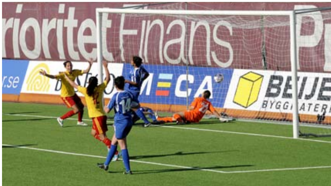
Målkallas på Tyresövallen.

Årets finalmatcher, alltså både damfinalen den 22 maj och herrfinalen den 25 maj, spelas på Estádio do Sport Lisboa e Benfica (Estádio da Luz), en anläggning som kan ta 65 000 åskådare! Vågar vi gissa att några av platserna beläggs med glada tyresösupportrar, som inte vill missa den historiska chansen att vara med om en Champions League-final.