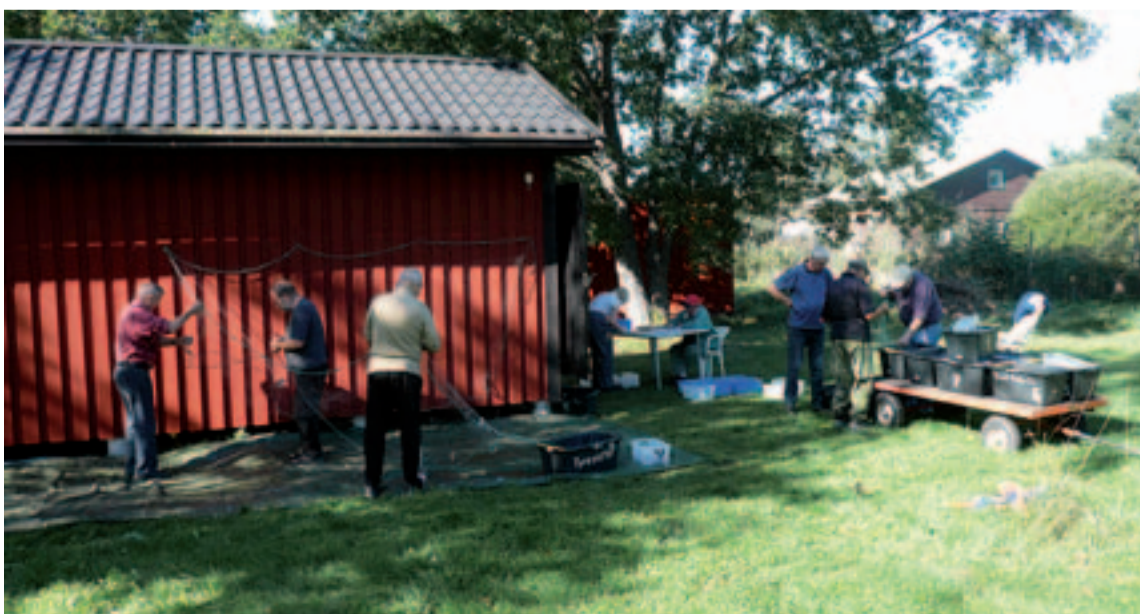
Näten från provfisket rensas med frivilliga krafter.