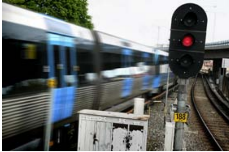
Tunnelbana till Tyresö får rött ljus av tyresöborna.