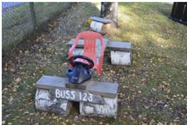
Med hjälp av stubbar, äldre dataspelstillbehör har förskolans buss skapats.

I en särskild del av gården återfinns barnens egna gröna hörna för odlingar.