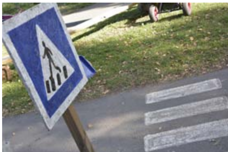
Gården har en egen del för cyklar med busshållplats och busstation.