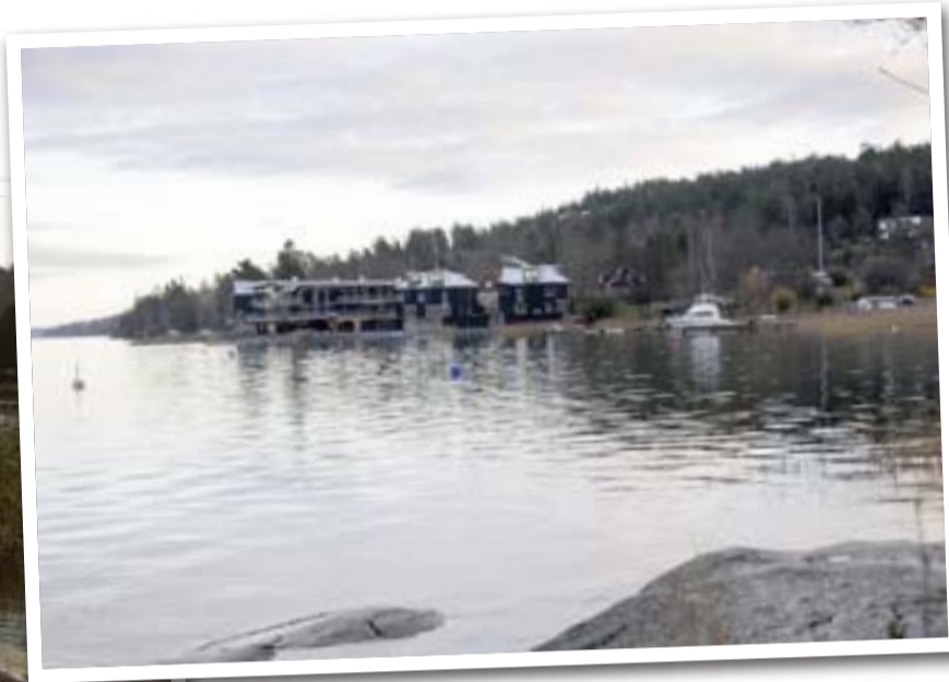
På den gamla varvstomten har mycket hunnit hända under nio år. Varvet är rivet och har givit plats åt ett modernt bostadsområde i den vackra skärgårdsnaturen.