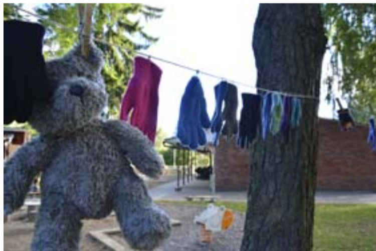
Omaka vantar pryder klädlinor mellan träd och skapar färg och liv i vinden.