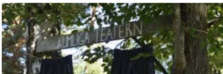
Möjligheter för barnen att stå på scen.