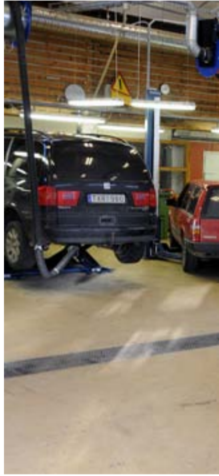
Tyresö gymnasiums servicehall är stor och ljus.