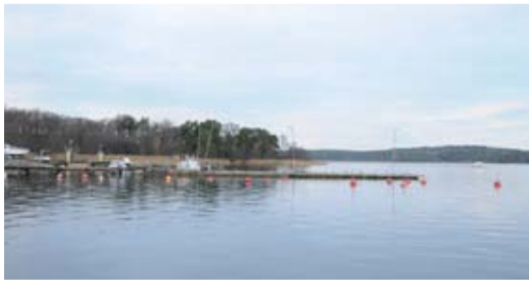
Vid Tyresö Strand, intill strandbadet, har funnits en båtklubb i många år. Besqabs byggande av Strandängarna påverkar klubben. Flera förslag om utformning och placering av framtida båtbyggor har utformats av Besqab i samråd med kommunen. Inga beslut är ännu tagna.

S. Dufva är en kulturintresserad tyresöbo som lämnar små betraktelser från olika evenemang han, helt inkognito, bevistat.