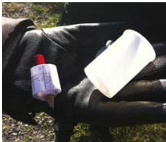
När du hittat fram registrerar du dig...