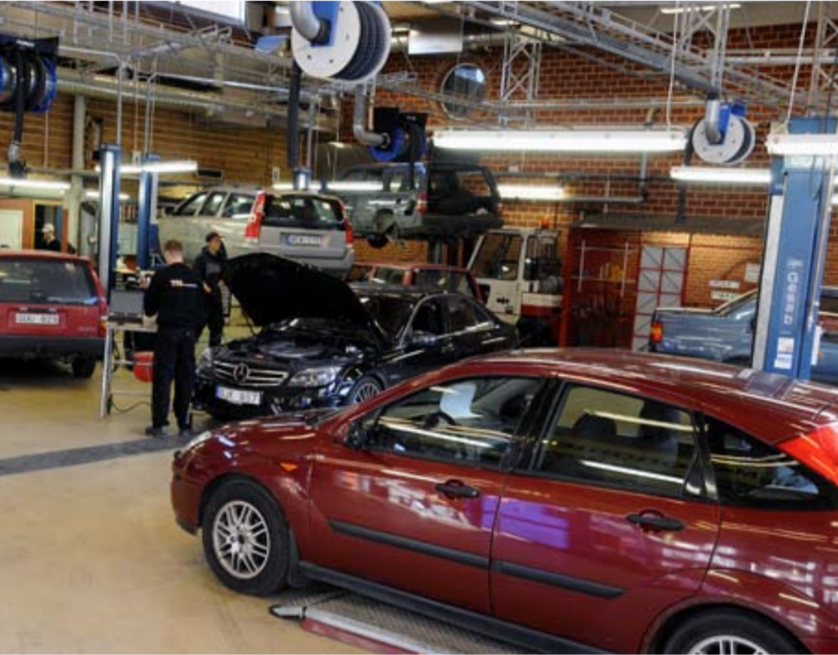
Luftig. Kän att få lämna sin bil på service/repairation är tämligen lång. Året är nu fyllt.