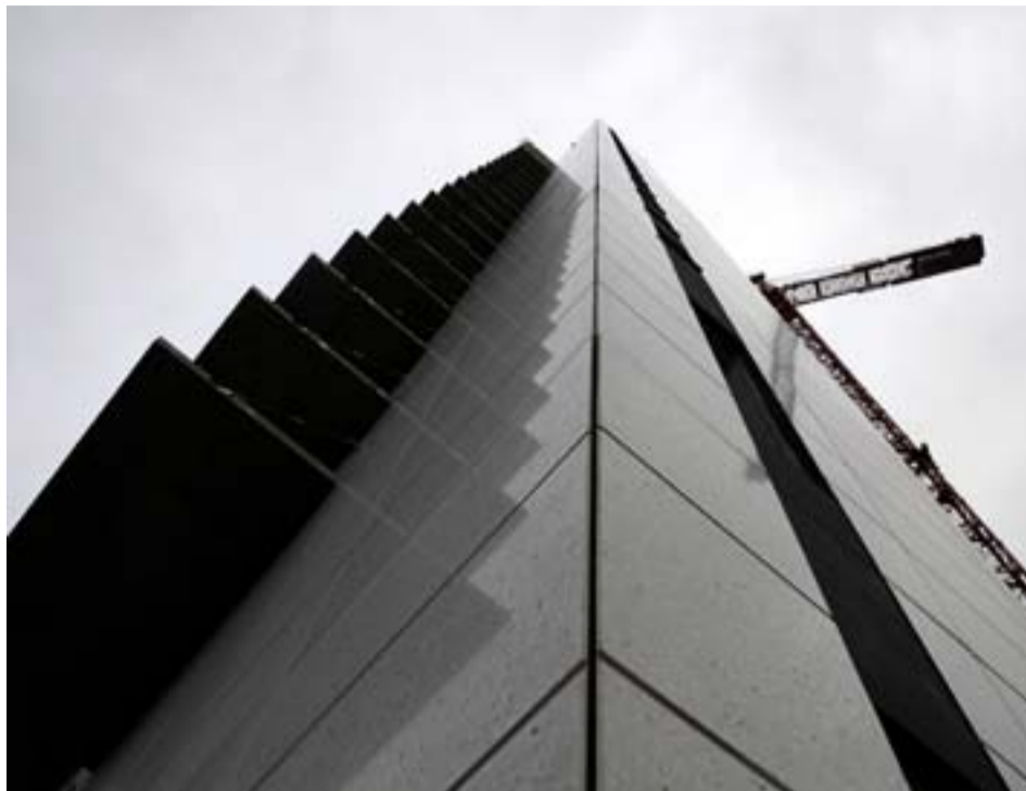
Att bygga hotell i Tyresö är kanske lika osannolikt som att bygga högghus i centrala Tyresö. Men varför inte? Man kan väl bygga till några våningar på "Tyresö View" och göra en roterande "skybar" högst upp?

Plats för hotellet är inte avgjort, men önskemålet är att hotellet hamnar i de centrala delarna.