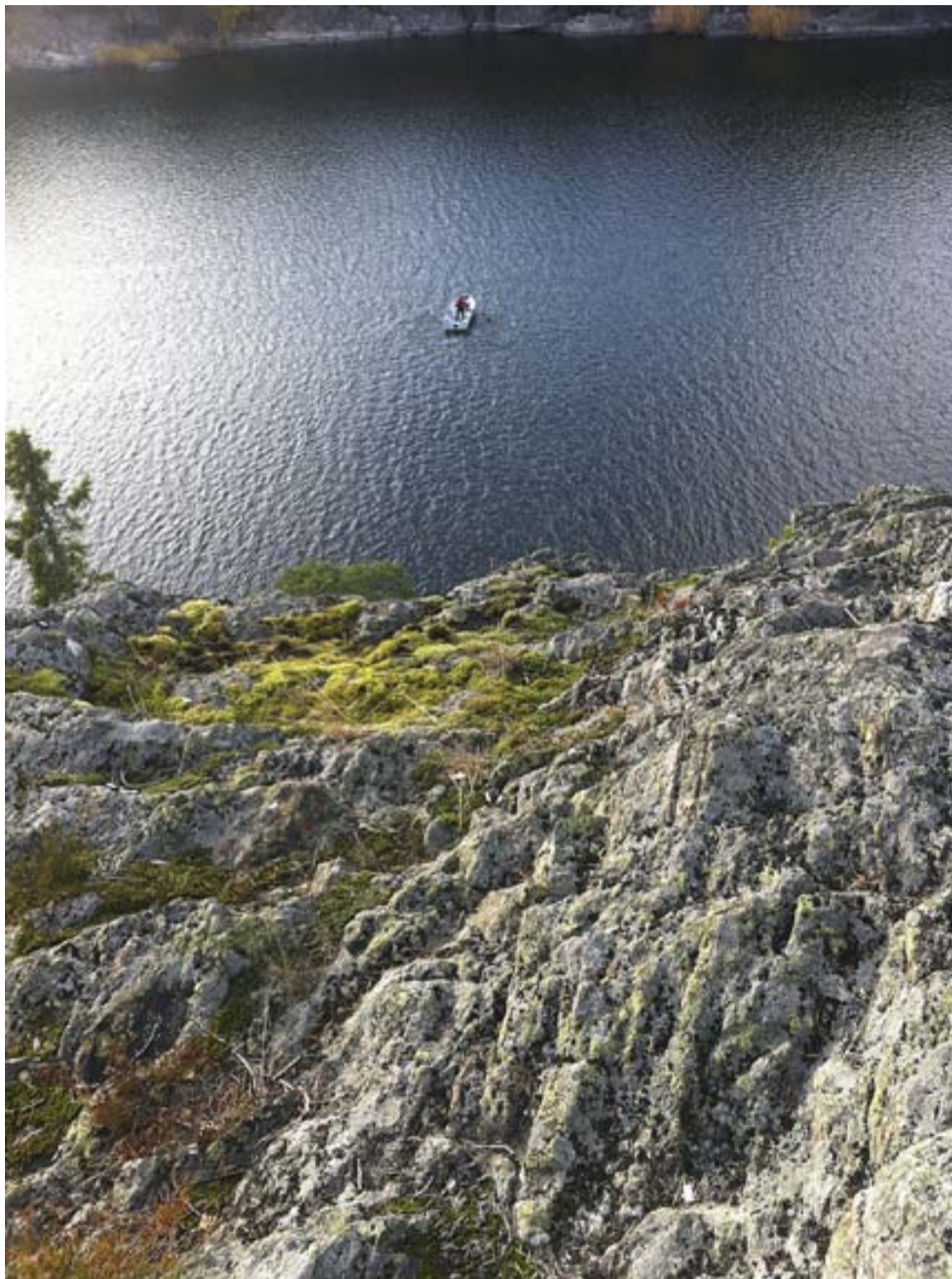
Geocaching – ett spännande sätt att upptäcka nya platser.