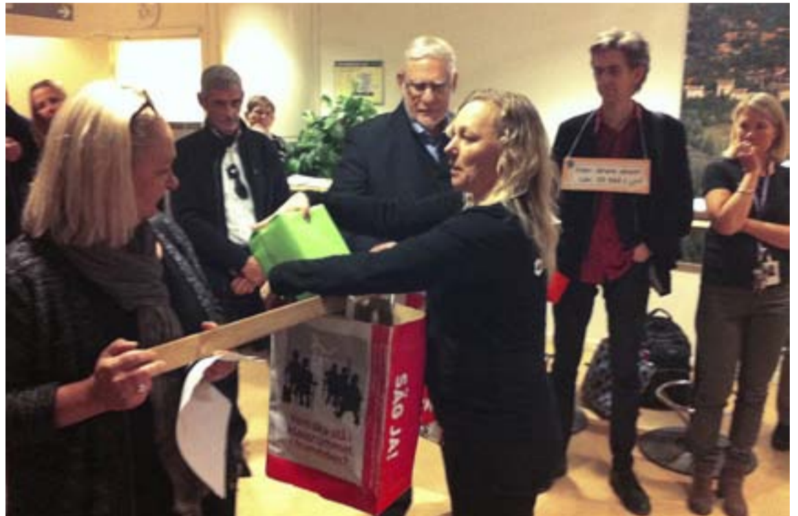
Läraryrket uppvaktar kommunfullmäktige och påminner om gamla löften.