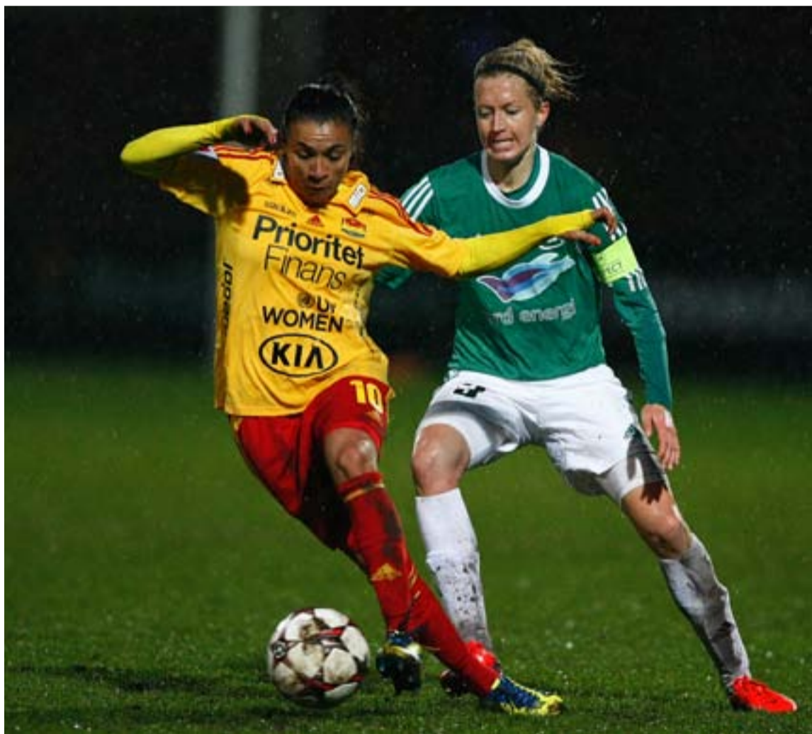
Marta med bollen i bortamatchen mot danska Fortuna Hjørring.