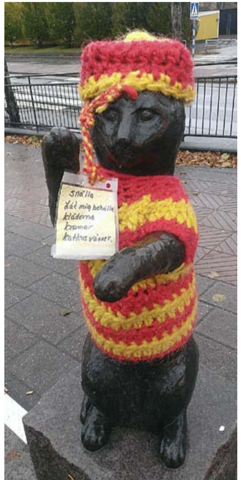
Kattstatyn utanför Tyresö centrum har fått kläder. Det är inte första gången det händer, men denna gång har kläderna en adressat, "Kattens väner".