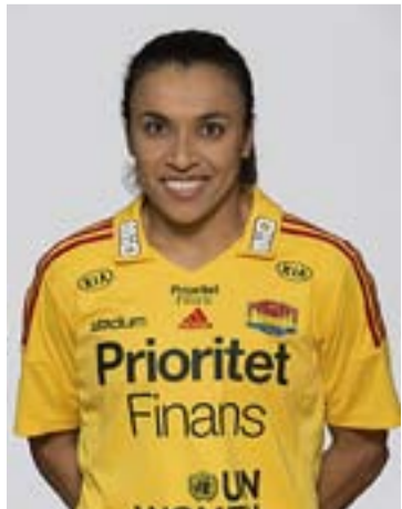
Marta Vieira da Silva.