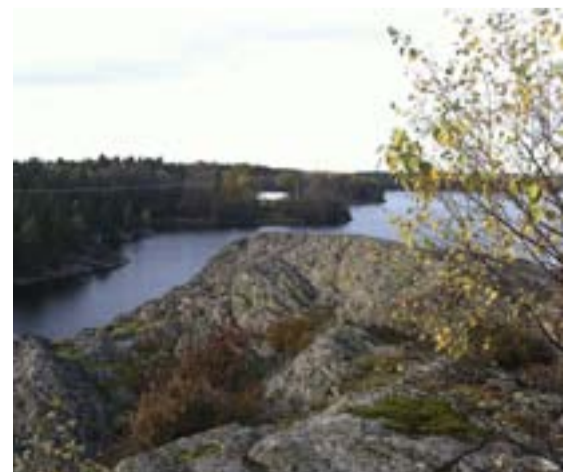
... sedan bär det av mot nya mål.