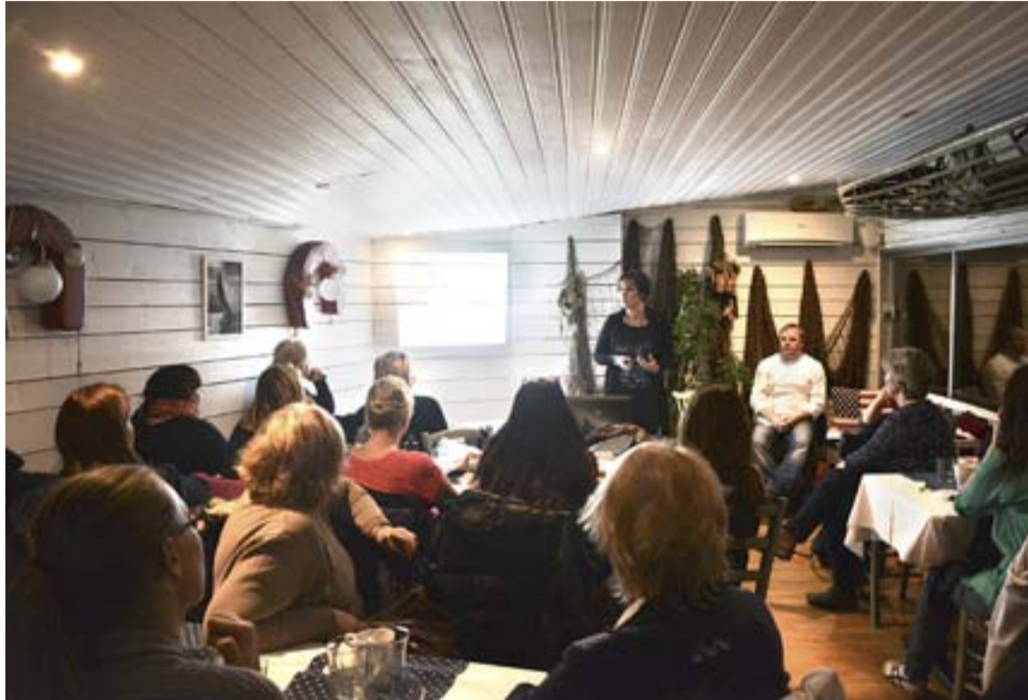
Det goda ryktet sprider sig och många lockas till "Torsdag i Trollbäcken".