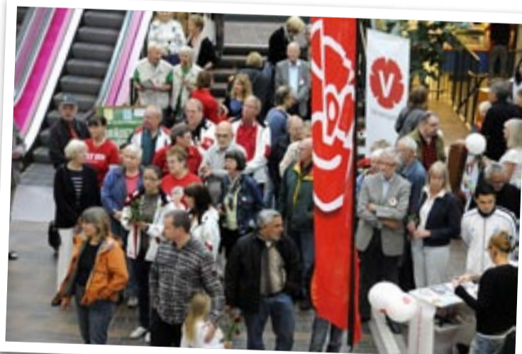
Publik i Tyresö centrum under Socialdemokraternas valspurt.