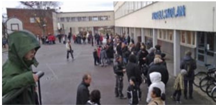
Vaccinationskaos – köerna var långa i Tyresö.

Omvandlingen av Östra Tyresö har fortsatt. Nya vägar, större skola samt vatten och avlopp byggs i högt tempo. Brevik ska omvandlas från fritidshusområde till permanentboende. Det sker dock inte utan kritik. När kommunen vill lägga upp asfalt vid Tegelbruksvägen utbryter en stor proteströrelse bland de närboende som vill rädda Kalvfjärdens vattenkvalitet.