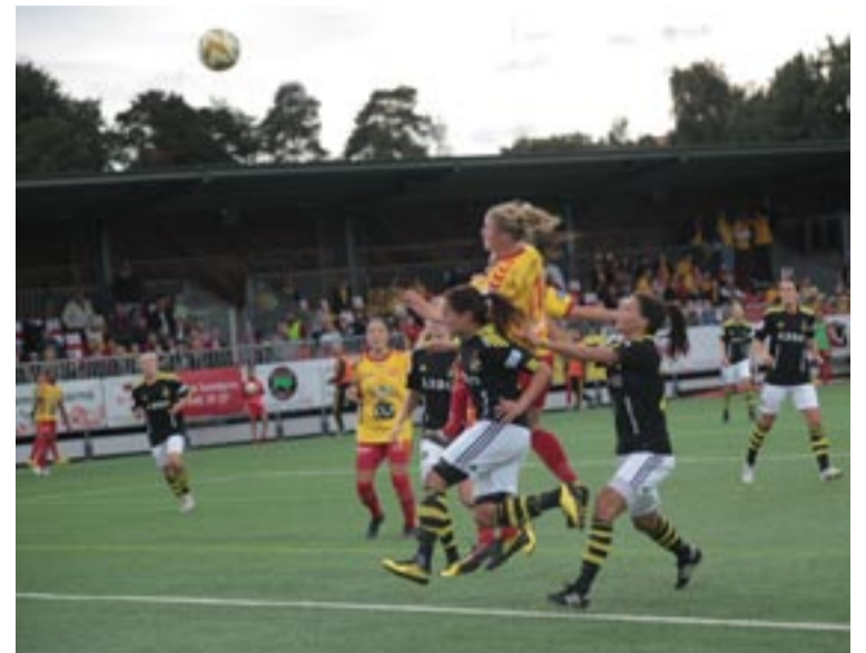
AIK jagar förgäves mot Tyresö FF.

– Vi ligger just nu femma i tabellen, två poäng efter fyran Jitex