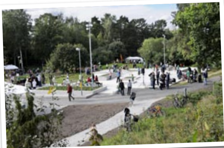
Skateparkens invigning välkomnades av åksugna ungdomar.