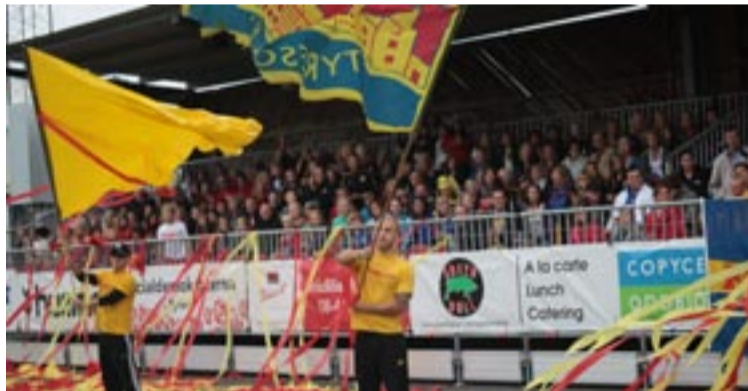
Starkt stöd från 1 100 supportrar på läktarna.