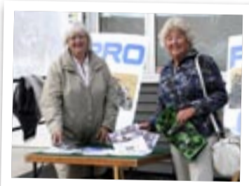
PRO berättade om sin verksamhet.