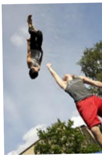
GK Trollbäckens ungdomar visade prov på sin gymnastik.