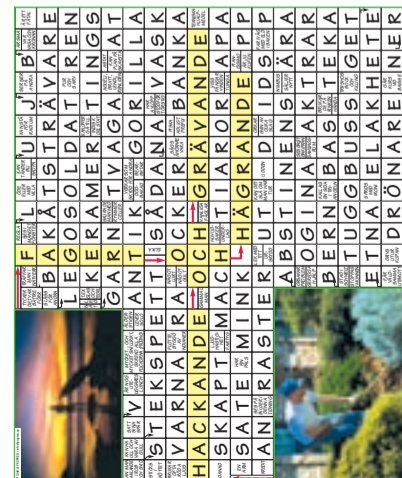
Rätta lösningen på kryss nr 5, 2010.