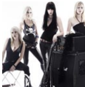
Crucified Barbara.