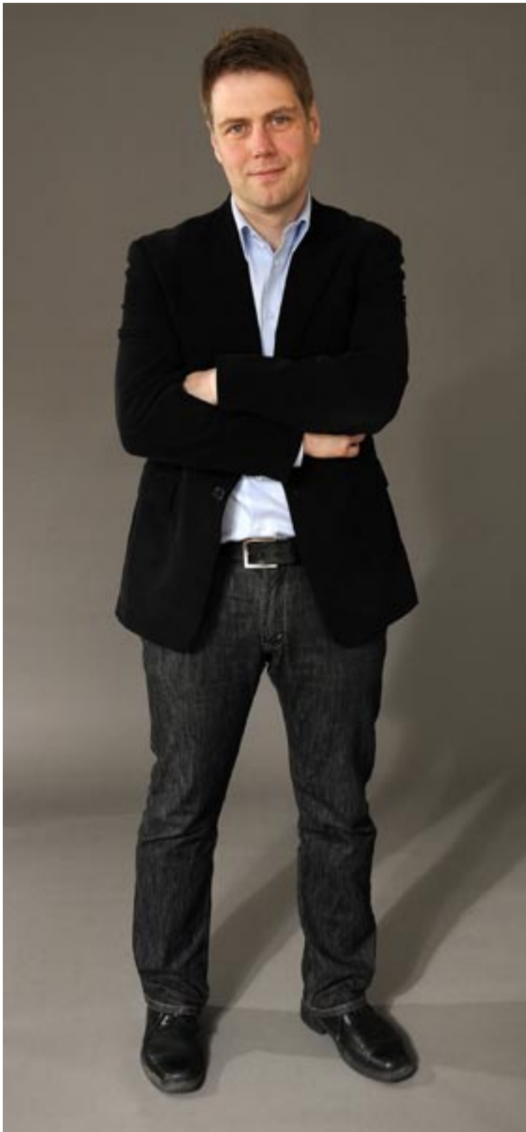
– Vi tänker inte acceptera att Tyresö alltid hamnar i botten på skolrankningar. Fler behöriga lärare, mindre klasser och barngrupper samt bättre uppföljning vill vi ha i kommunen.

nyhetstips: redaktion@tyresonyheter.nu hemsida: www.tyresonyheter.nu