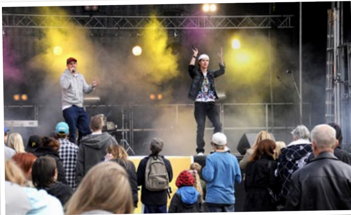
Dogge Doggelito uppträdde på stora scenen.