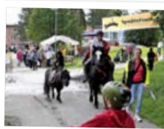
Rundmars gård anordnade ponnyridning – populärt för de yngre.