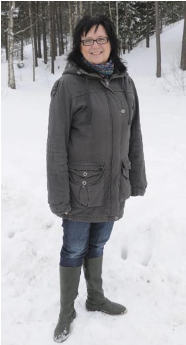
Therese värnar om Tyresö, inte minst när det gäller skola, bostäder till unga och föreningslivet.