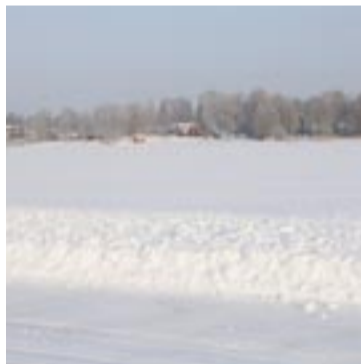
Stenbadet ser inte riktigt ut som på sommaren.