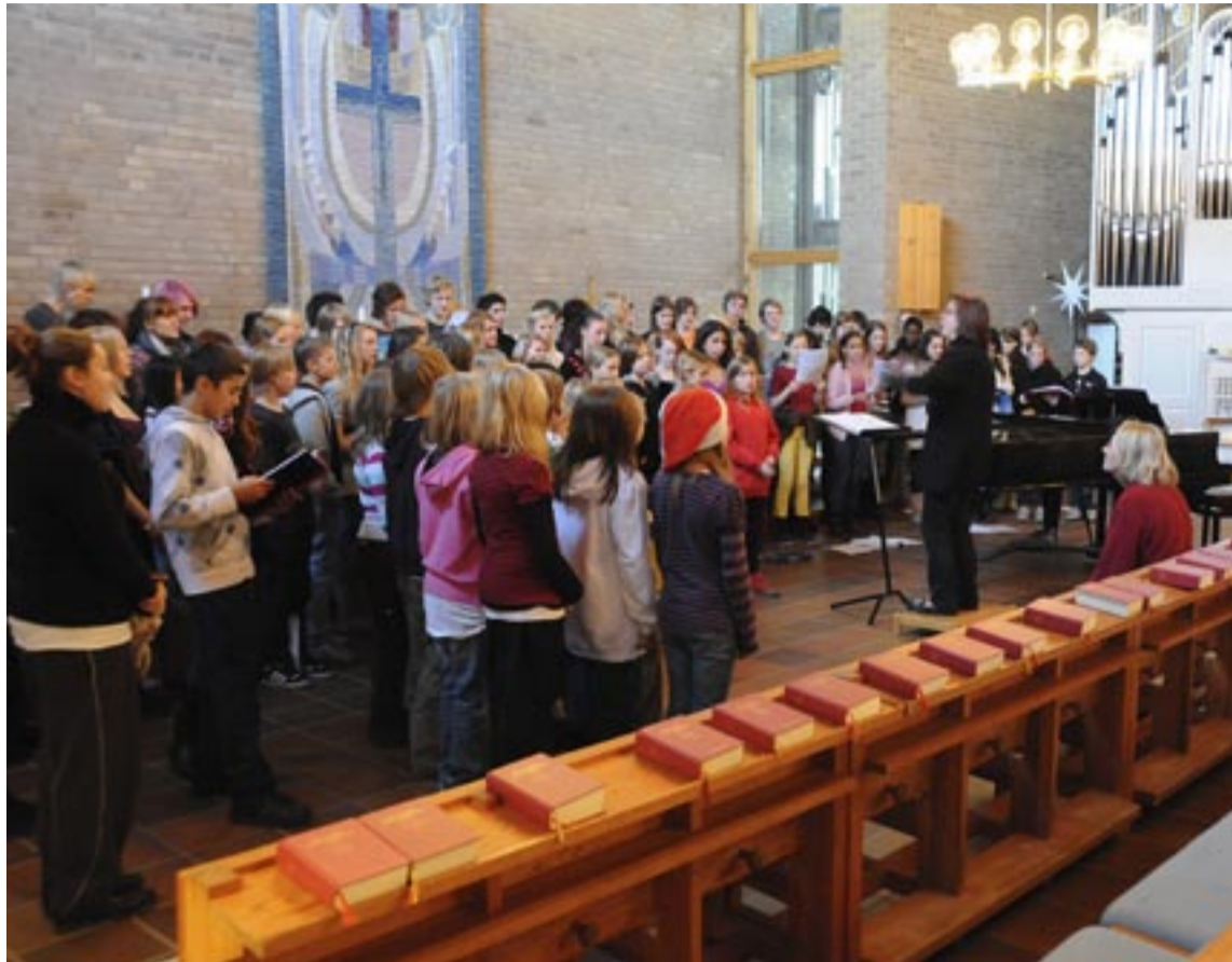
Den stoppade intagningen till årskurs fyra kan bli en dödsstöt för verksamheten.

– Det vore förfärligt om musikkläserna läggs ned. Vi social-