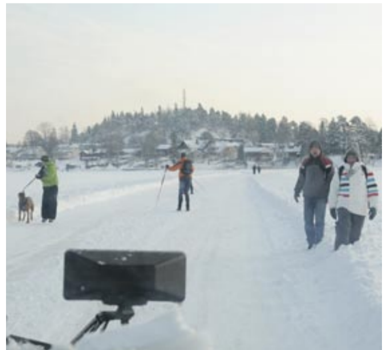
Åter vid Näsby udde efter att ha plogat hela banan möts vi av trollbäckens borna på väg ut.