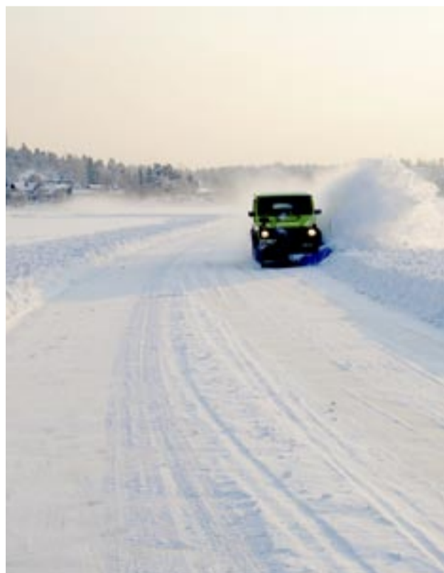
Näsby udde till vänster i bakgrunden.