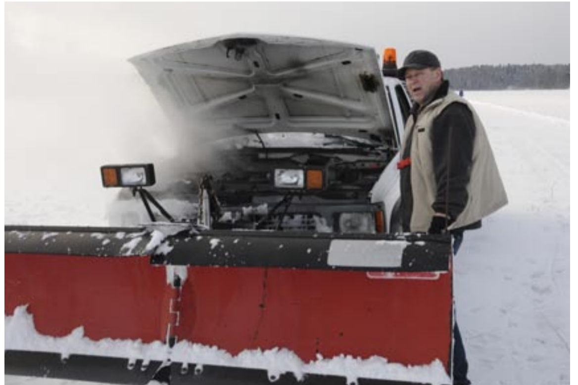
Den här bilen är gjord för varmare klimat. Oljekylaren täpps igen och gör att motorns kylare inte får luft. Då kokar den och man får ta en paus och fylla vätska.