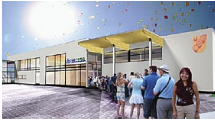
Så här kan entrén till den nya simhallen se ut.

– men osäkert om den blir tillgänglig för funktionshindrade och barnvagnar