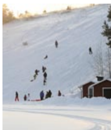
Se upp i backen! Full aktivitet i Albybacken.