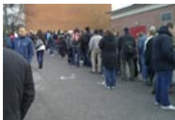
Minnet av köerna kanske fick några att avstå andra sprutan.