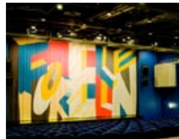
Nytt, fräsch och bättre blir det för biobesökarna i Tyresö.