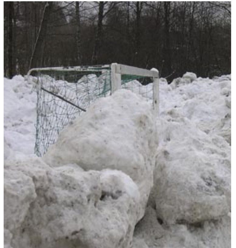
Snöröjarna i Tyresö har slopat 4-3-3 och 5-3-2 och skapat det nya totalförsvarssystemet i fotboll. Det testas just nu på Sofiebergers fotbollsplan och Tyresö Nyheter kan visa hur det är tänkt att fungera. Det ser också ut som om knattarna i Hanvikens SK får vänta på sin säsongsstart. Michiko (Akita) tippas på i bästa fall juni i stället för april.